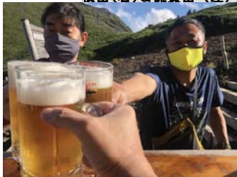
同級生と至福のひとつ