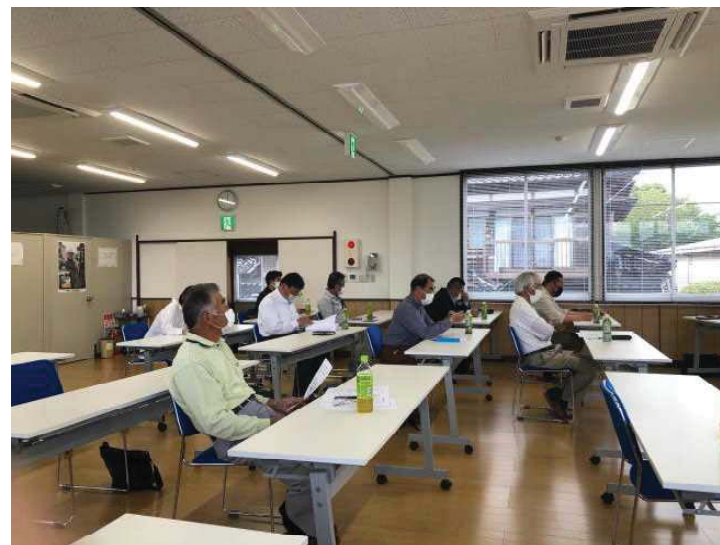
2年ぶりの長生支部総会。