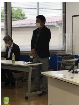
大倉前支部長：お疲れ様でした！

現在、未だ新型コロナウイルス感染症の収束の兆しが見えない中で、各活動が制限され、また急激な変化も求められております。 世界が近年経験したことのない状況の中で、各業界におかれましても、テレワークの実施など様々な対応していると伺っております。 本支部でも理事会を ZOOM にて行うなどの対応となっております。 建築業界もまん延防止等対策重点措置感染防止対策に取り組むなか、ウッドショックに見舞われ多大なる影響を及ぼしております。 新型コロナウイルスの早めの収束を切に思い、今の状況を打破し平穏な日々を取り戻せるよう頑張りましょう。 影響が納まり次第改めて行事・活動もご案内・ご紹介いたしますので、お待ちいただくとともに支部活動の際には多数の方のご参加をお願い申し上げます。 最後に、会員各位の力強いご支援とご協力を賜りますようお願い申し上げ、支部長就任の挨拶とさせていただきます。