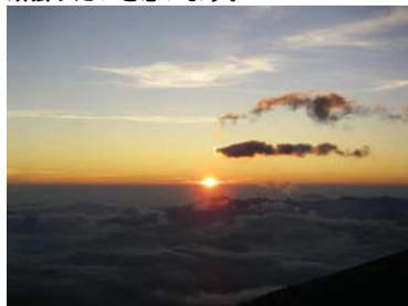
硫黄岳山荘から望む御来光