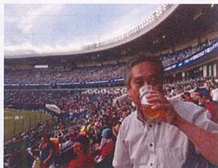
野球観戦：ZOZOマリンスタジアムより