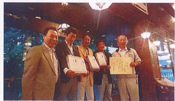
長生優勝メンバー