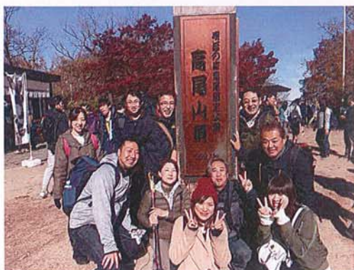
集合写真2 山頂より