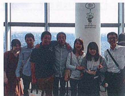
東京スカイツリー展望室にて