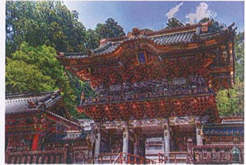
関ブロ栃木大会イメージ