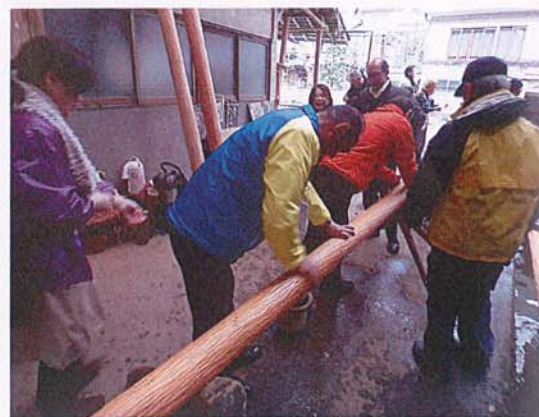
磨き丸太の実体験。

帰路バスが渋滞に巻き込まれ乗車予定の新幹線の時間が微妙に・・・京都建築士会の方の妙案で間一