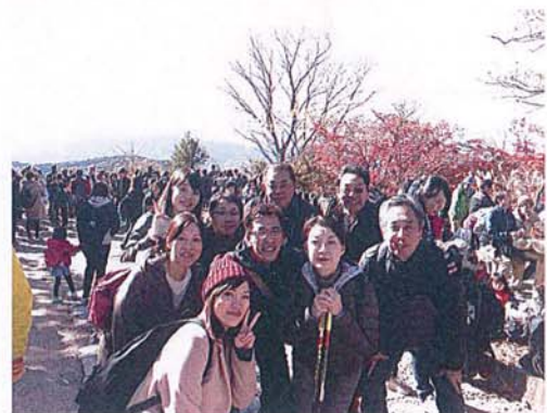
集合写真3 山頂より