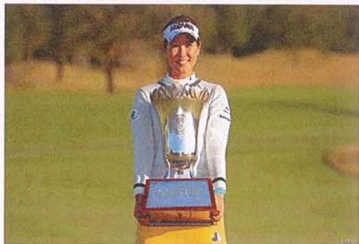
伊藤園レディース2017より