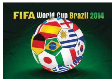
ザックジャパン残念....

野球!サッカー!ゴルフ!..... etc スポーツシーズンまっただ中です! それぞれのひいきチーム、ひいき選手が勝負に勝った時は実に気分がいいものです! アルコールの好きな方だったらいつもの飲量をついつい越えてしまうのではないのでしょうか? そんなスポーツ観戦に気の合うみんなで LET'S GO!