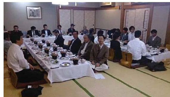
通常総会懇親会風景