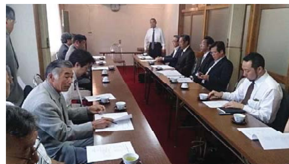
平成26年度建築士会長生支部通常総会風景