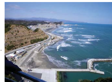
塩屋崎灯台からの眺め

最後に、本部総務委員会の皆様には感謝を申し上げますと共に今後もより良い研修旅行計画をお願いいたします。