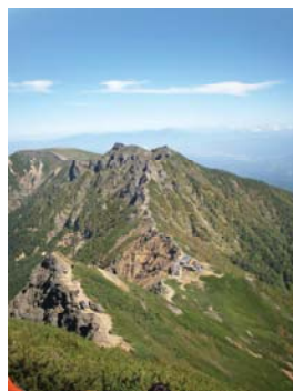
赤岳登山 きつかった... (疲)

ウォーキング、サイクリング、ハイキング、キャンプ BBQ、山登り..... etc とにかく体を動かす事が大好きな方! 日頃の運動不足を感じている方! 共に爽快な汗を流しませんか!! 今年、支部長は100km歩け大会にエントリー!!かも?