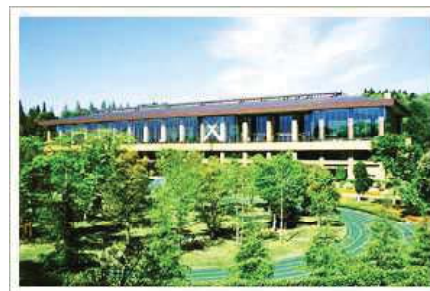
日本メディカルトレーニングセンター (旧エアロビクスセンター)

生命の森リゾート： http://www.seimei-no-mori.com/