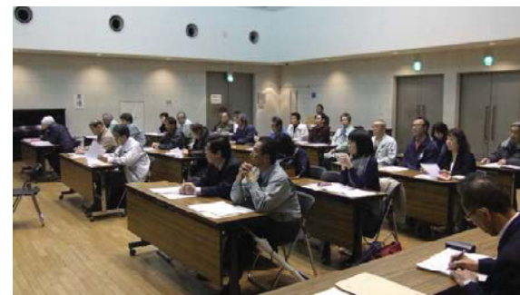
建築関係実務講習会風景