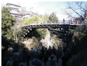
日本三奇橋 甲斐の猿橋