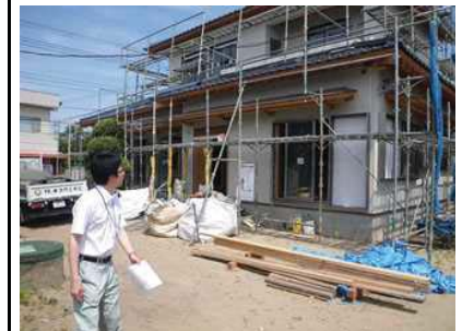
2013.6.5 白子町のパトロールより