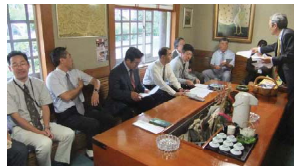
平成25年度建築士会長生支部通常総会風景