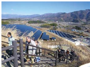
米倉山太陽光発電所

帰りのバスではさらに盛り上がり！？お酒と土産と思い出の香りがぎっしり詰めこまれた、有意義な旅行に締めくくることができました。