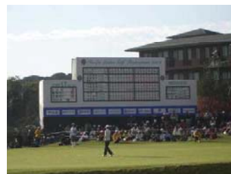
伊藤園レディース観戦

野球!サッカー!ゴルフ!..... etc スポーツシーズンまっただ中です! それぞれのひいきチーム、ひいき選手が勝負に勝った時は実に気分がいいものです! アルコールの好きな方だったらいつもの飲量をついつい越えてしまうのではないのでしょうか? そんなスポーツ観戦に気の合うみんなで LET'S GO!