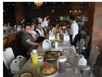
建築士会親睦ゴルフ大会打上

仲間内でゴルフを始める方達が増えてきました。 最近では2ヶ月に1回のわりあいでは有志による4~5組程度のゴルフコンペを開催しています。 初心者から上級者、老若男女問わずみんなで楽しんでいます。 毎年6月には建築士会親睦ゴルフ大会にも参加し各々の腕試しの機会もありますよ! 是非私もという方、WELCOMEです!